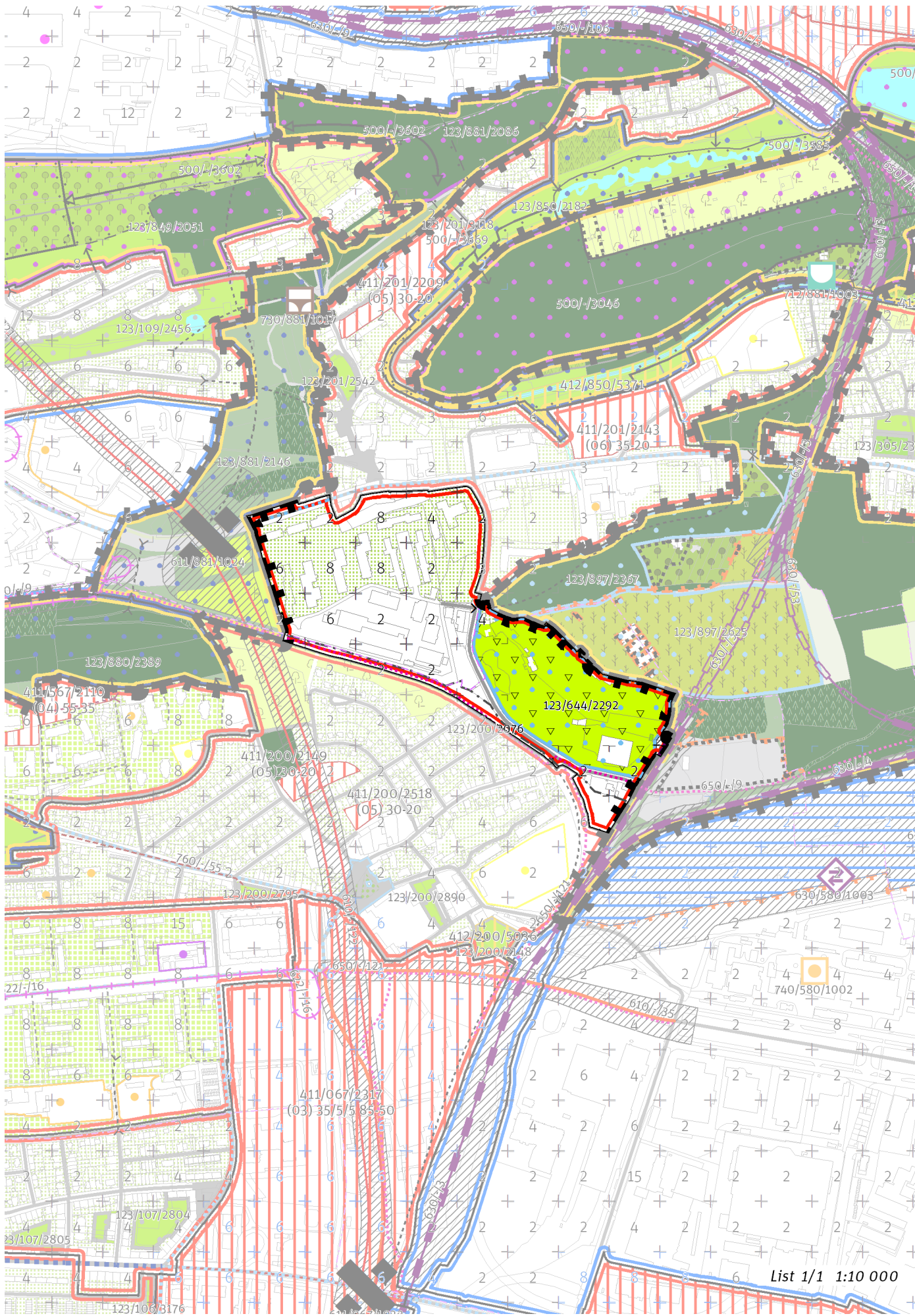
List 1/1 1:10 000