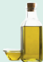
Jedlý olej a tuk