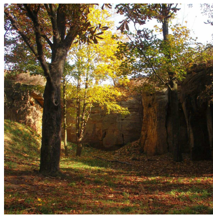
pískovcové skály nad rybníkem Velká Obůrka