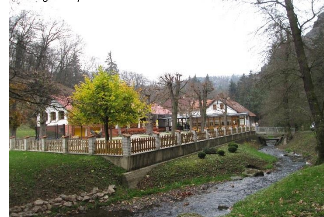
Na fotografii: Výletní restaurace Dívčí skok.