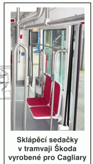
Sklápěcí sedačky v tramvaji Škoda vyrobené pro Cagliari