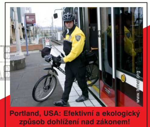
Portland, USA: Efektivní a ekologický způsob dohlázení nad zákonem!

Cestující vidí, kdy uvnitř není volné místo