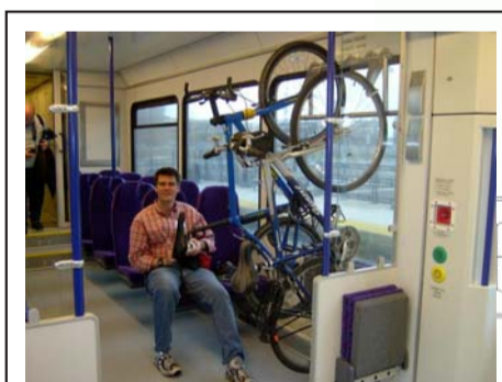
Lehké metro RiverLINE, Camden - Trenton NJ, USA www.flickr.com/photos/bikesontransit/36607757