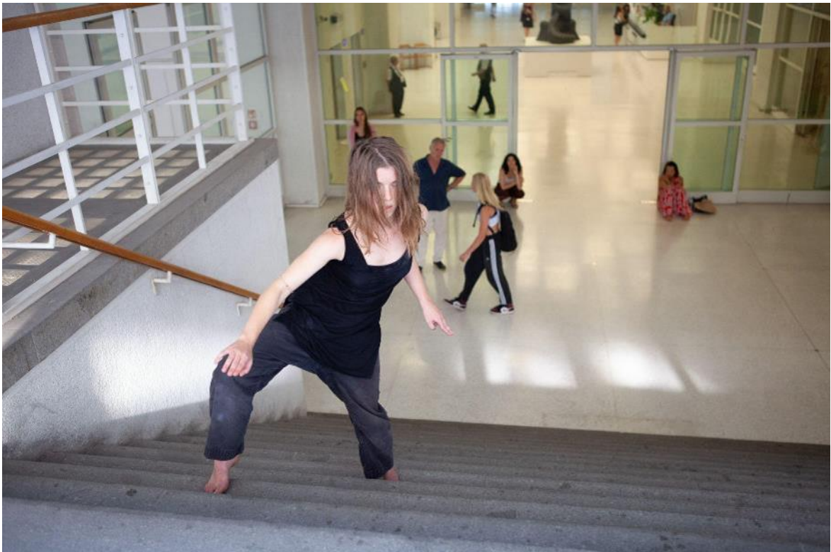
Tanec v galerii 2023, rezidence pro choreografy s koučinkem.