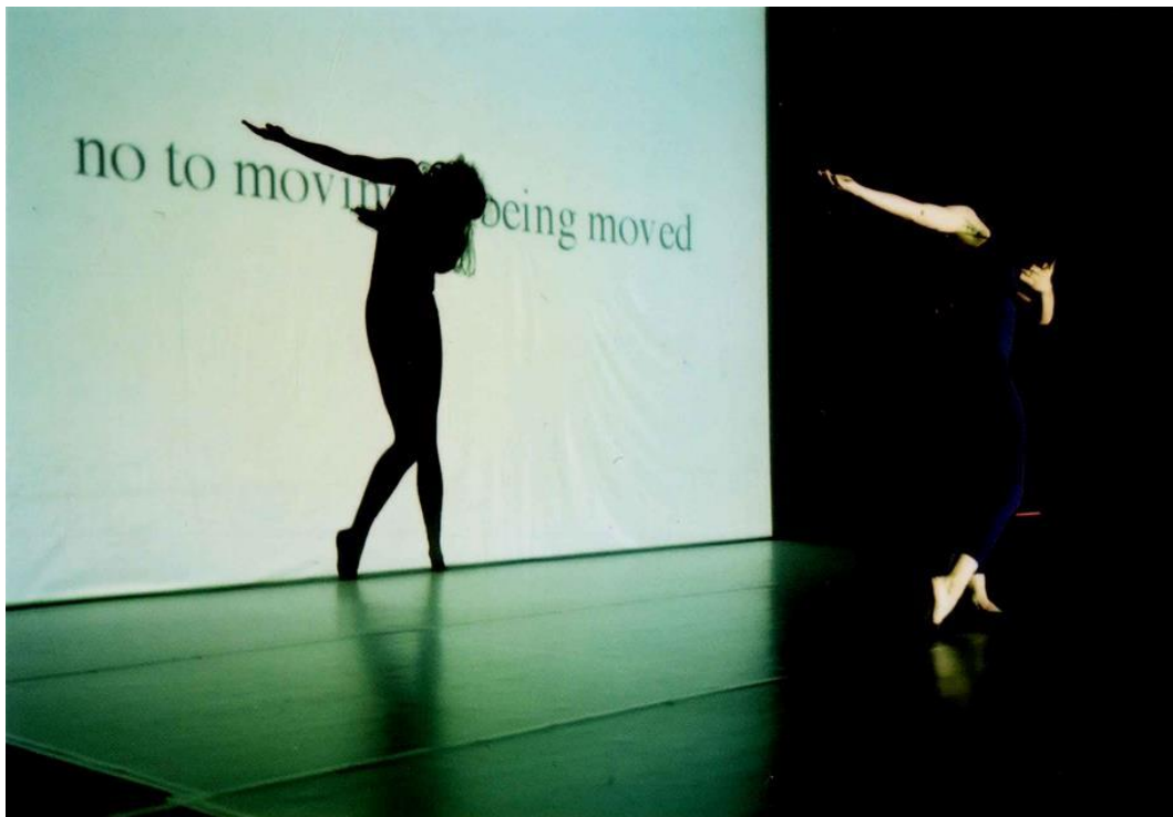
Alice Chauchat, Quotation Marks Me , 2001.

Dance in the Gallery is a transdisciplinary project exploring multi-layered connections between movement and visual arts in the site-specific context of an art museum. The Centre for Choreographic Development SE.S.TA organises the project annually with the National Gallery Prague and other museums and galleries. SE.S.TA is the only centre of its kind in Czechia. Since 1999, it has been committed to developing movement art – contemporary dance, new circus and physical theatre – in an international and interdisciplinary environment.