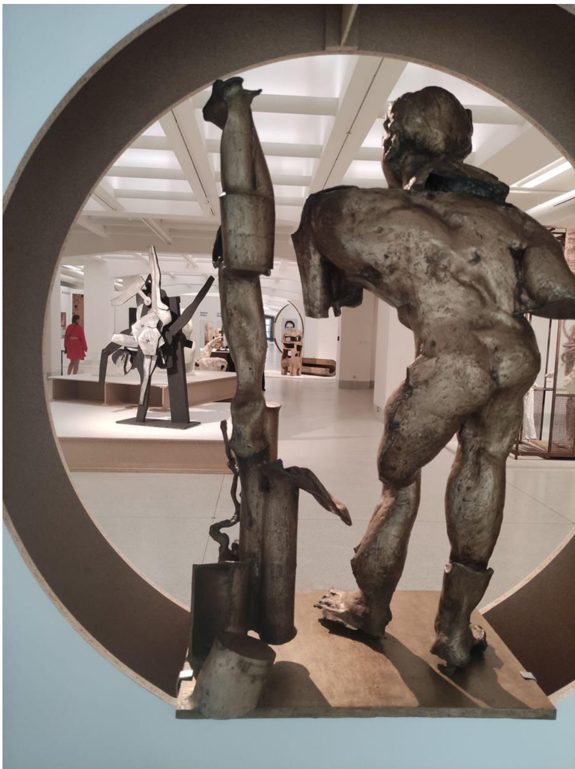
Pohled do expozice se sochou Františka Štorka ( Narcis , 1985, bronz).