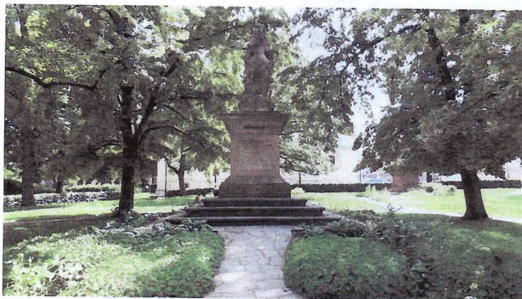
3. Karlachovy sady - vyplení a údržba záhonů: