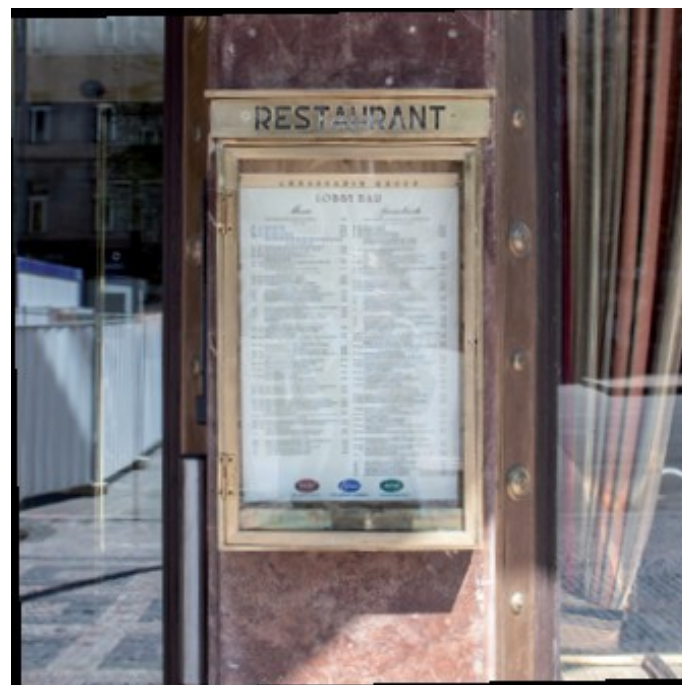
Elegantní vitrina z kvalitního kovu.