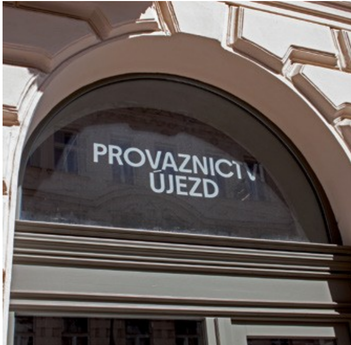
Polep zhotovený tak, aby evokoval pískování skla.