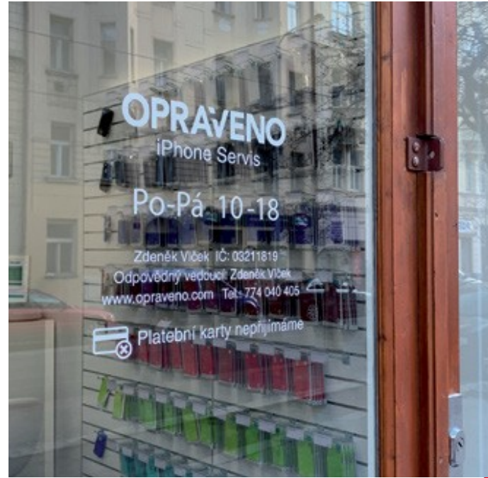
Další příklad elegantně provedeného polepu z řezané grafiky.