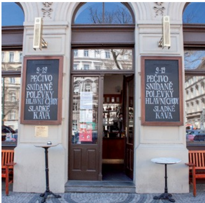
Tabule, správně umístěné souměrně vedle vstupu do provozovny.