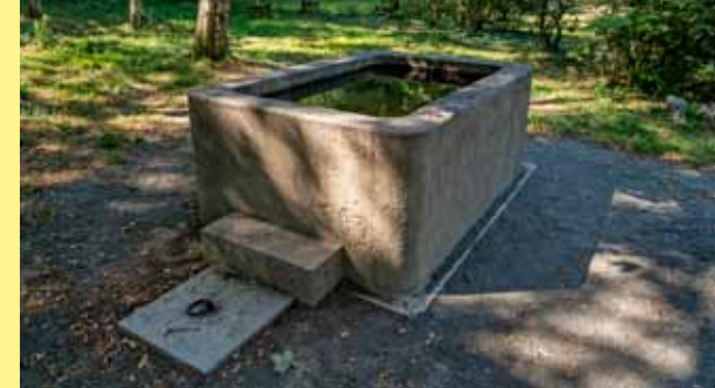
▲ Bývalé pítka pro koně Autorské objekty Čítárna ▼