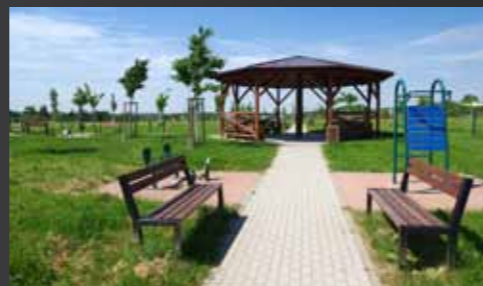
Dětské hřiště v severní části krajinného parku