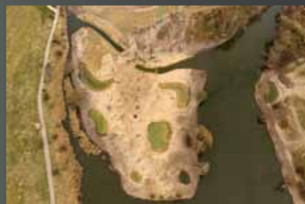
Budování ostrova s tůňkami v roce 2020

Výstavba parku byla zahájena v roce 2014 hrubými terénními úpravami a stavbou první části cestní sítě včetně asfaltového okruhu pro bruslaře s veřejným osvětlením. V této době také došlo k navážení zeminy do dvou umělých útvarů. Mezi nimi byla vyhloubena tůň. V dalších letech došlo k ozelenění severní části parku, a to založením několika větších remízků, kde bylo zasaženo více než 10 000 lesních stromků. Dále byl park oživen výsadbou téměř 400 alejových stromů uspořádaných do stromořadí podél parkových cest, nebo jako solitérní vý-