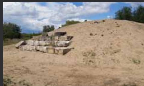
Písečná duna u rybníka Martiňák

sadba na loukách. V roce 2018 byla tato část parku dokončena vybudováním velkého oploceného dětského hřiště a dřevěného altánu a umístěním venkovních fitness prvků.