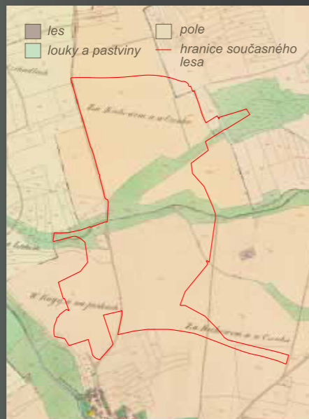
Území krajinného parku na mapě stabilního katastru z roku 1848

„Čeněk“ je dřívější název místního rybníka, dnes spíše zvaného Martiňák. V historických záznamech a mapách se setkáváme ještě s podobným názvem „V Čeňku“. V minulosti bylo toto území obhospodařováno výhradně zemědělsky, a to dokonce až do roku 2007. Poté došlo v severní části lokality k navedení a rozhrnutí ornice ze staveb sídliště na Černém Mostě. Na potoce Chvalka bylo v 18. století několik menších rybníků, které byly později zrušeny. V 50. letech 20. století byl pak obnoven jediný rybník ležící uprostřed nynějšího parku – rybník Martiňák. V roce 2009 proběhla jeho celková revitalizace včetně kompletního odbahnění a opravy všech objektů (stavidlo, bezpečnostní přeliv a loviště).