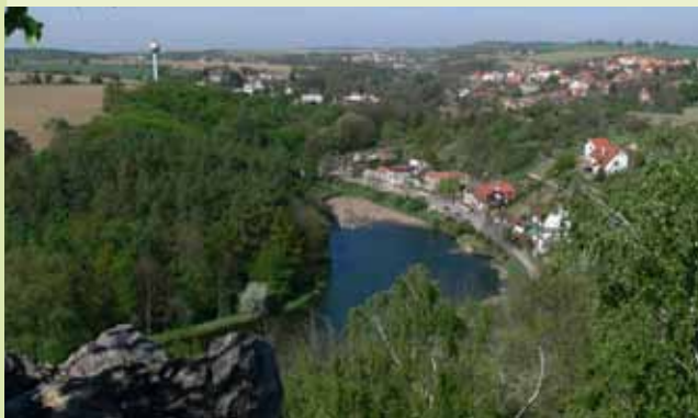
Výhled z Holého vrchu

bu, Suchdol, sedlo Kozích hřbetů a Únětice do severovýchodních zemí).