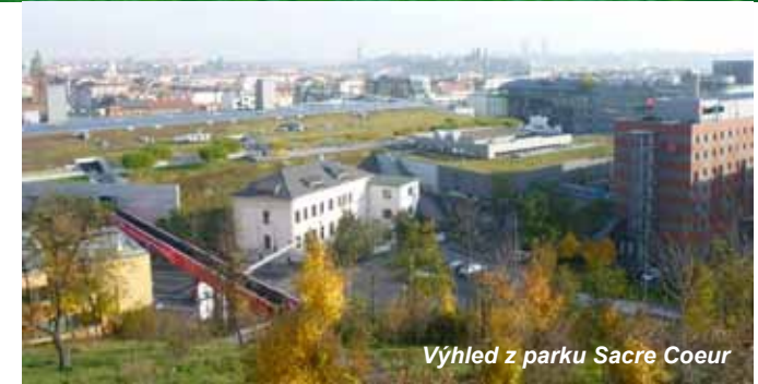
Výhled z parku Sacré Coeur

Za cvičištěm podejdete unikátní lanovku (11), která spojuje dvě úrovně hotelu Mövempick a vstoupíte do dalšího parku na trase vycházky, který se jmenuje Mrázovka. Opět je jen na vás, jak si ho projdete. Východ z něj hledejte na opačném konci. Pod dětským hřištěm sestupujte zatáčkami po malé pěšince přímo do ulice Na Zatlance. Zde odbočte vpravo a na první křižovatce vlevo do ulice