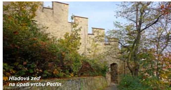
Hladová zeď na úpatí vrchu Petřín