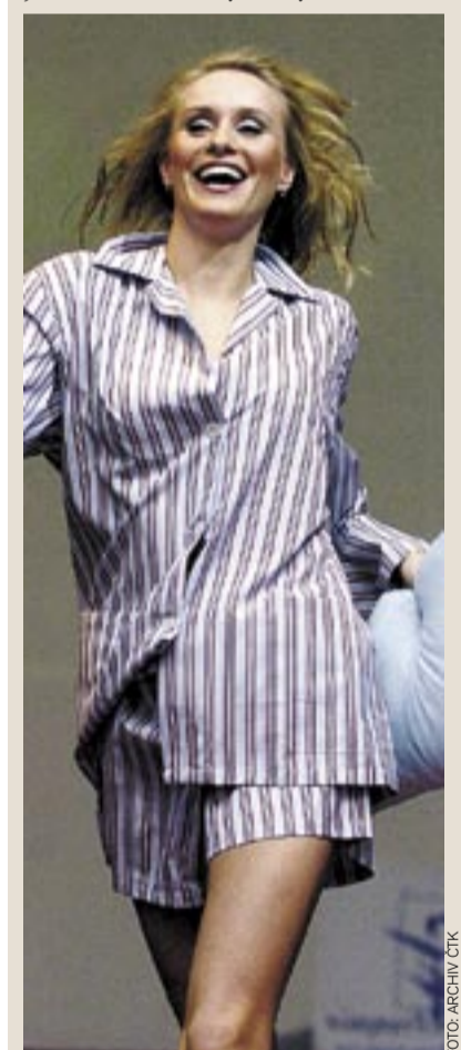
MÓDNÍ PŘEHLÍDKA pánských košil, které předváděly finalistky České Miss.

Bydlet v Praze bylo vždy mým přáním a momentálně trávím v Praze třetí léto. Jsem maximálně nadšená a Praha patří mezi nejkrásnější místa, která jsem kdy viděla. Vždy má co nabídnout. Konkrétně zbožňuji procházky starou Prahou, kde nacházím nádherná zákoutí, miluji večerní romantické posezení na zahrádce u příjemné restaurace a vycházky na Petřín.