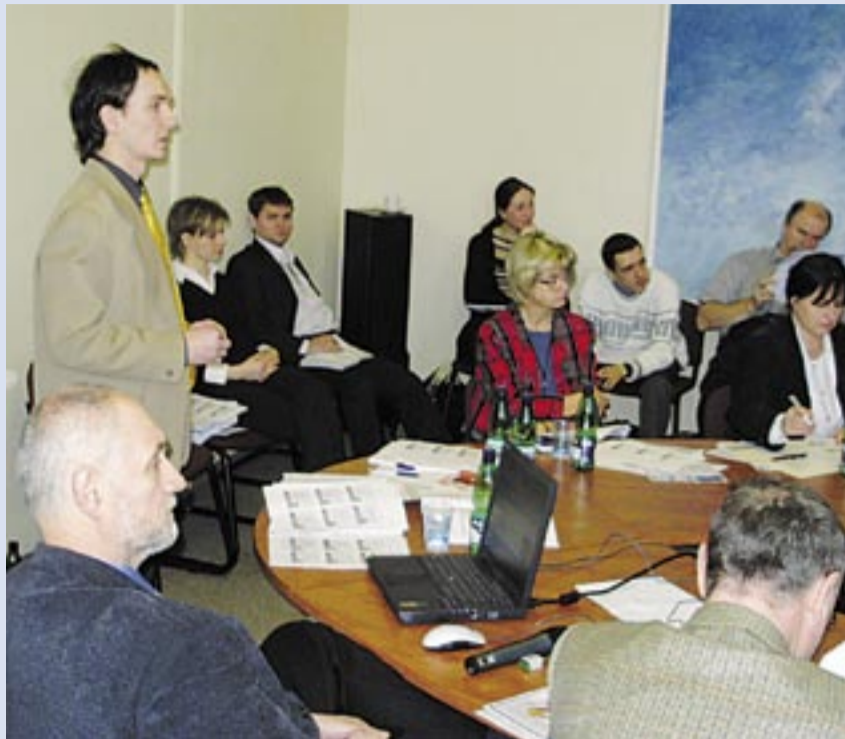
SEMINÁŘE. Zájem o předešlé semináře byl velký. Žadatele například seznámily s tím, jak si poradit s vyplněním elektronického formuláře žádosti ELZA.

„Tyto dva semináře organizujeme v souvislosti s vyhlášením třetí výzvy pro předkládaní projektů v programu JPD 2. Několik školení k předchozím výzvám mělo u žadatelů úspěch. Cílem půldenních školení je poskytnout uchazečům o dotace komplexní a aktuální informace, na jejichž základě by svůj projekt zpracovali snadněji a bezchybně,“ uvedla ředitelka odboru zahraničních vztahů a fon-