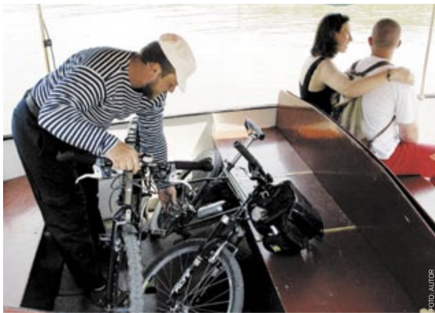
PŘÍVOZ ODPLOUVÁ. Vejdou se na něj jízdní kola i dobrá nálada.

přívozu svědčí to, že za prvních 12 dní převzelo 1300 lidí a 500 kol. Je tedy jasné, že znovuobjevený přívoz si své místo v pražské dopravě již našel. Jiří Juřík