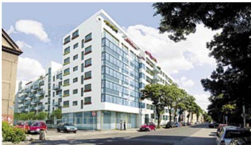
NOVÝ BYTOVÝ PROJEKT v Holešovicích po dokončení nabídne 264 bytů a 74 ateliérů.

Stále stoupá také počet nově postavených bytů. Nejvíce se staví v okrajových částech Prahy. „Nový byt lze v Praze pořídit již od 25 tisíc korun za metr čtvereční, ale výjimkou nejsou ani byty za 40 až 50 tisíc korun za metr čtvereční.“