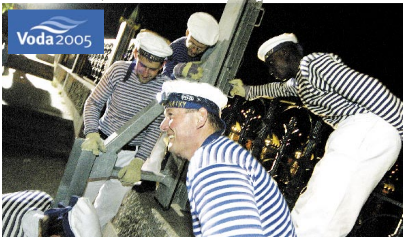
UKOTVENÍ KONSTRUKCE. Vedle profesionálů se do cvičení zapojili i dobrovolníci. Parta námořníků se do práce pořádně opřela.

Praha může být ochráněna během rekordních 11 hodin