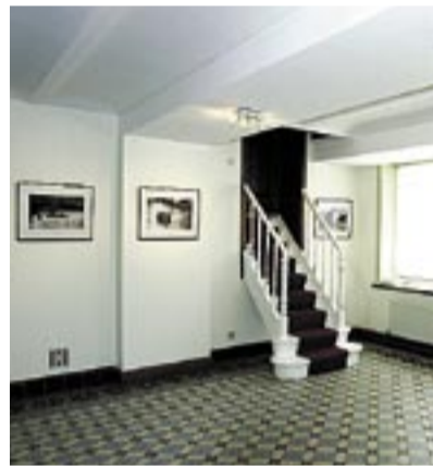
AGALERIE. V prostorách galerie Pražského domu se každoročně koná několik výstav nejen výtvarného umění.

litiků i obyvatel. Nejdůležitější součástí práce pražské delegace je snaha o co největší propagaci našeho hlavního města. Za tím účelem probíhají v Pražském domě společenské akce, koncerty, výstavy pražských a dalších českých umělců. Dům má v přízemí k dispozici vlastní galerii i krásný společenský sál. V něm se ode-