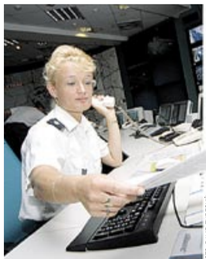
INFORMAČNÍ CENTRUM. Operátorka DIC poskytuje aktuální dopravní informace.

Průjezd hlavním městem nově usnadňují řidičům tabule rozmístěné v dopravní síti a dynamická navigace prostřednictvím zpráv z DIC přes satelit a rádiové vysílání. Informace o dopravní situaci jsou navíc veřejnosti v rámci několikaměsíčního zkušebního provozu poskytovány také přes mobilní telefony formou SMS a MMS zpráv či wap služeb přes internet. Unikátní systém dynamické navigace na bázi RDS-TMC (Radio Data System – Traffic Message Channel) spustila Praha jako vůbec první metropole v rámci postkomunistických