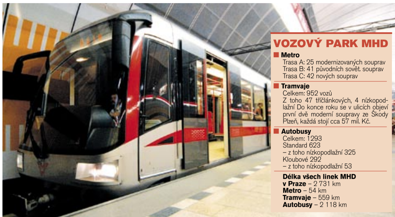
PRAŽSKÉ METRO. Na trase C jezdí již výhradně nové typy vozových souprav.

Pro zlepšení pohodlí a úrovně cestování jsou nezbytné i úpravy stanic metra – zejména těch, kde ještě chybí bezbariérový přístup. V současné době je z celkového počtu 53 stanic 27 s bezbariérovým přístupem. „V letošním roce budou výtahy vybaveny další stanice – obě přestupní na Florenci a Můstek na trase B a pravděpodobně i stanice Vltavská, která bude upravena v rámci popovodňových úprav,“ říká Kuchařová. K usnadnění pohybu cestujících