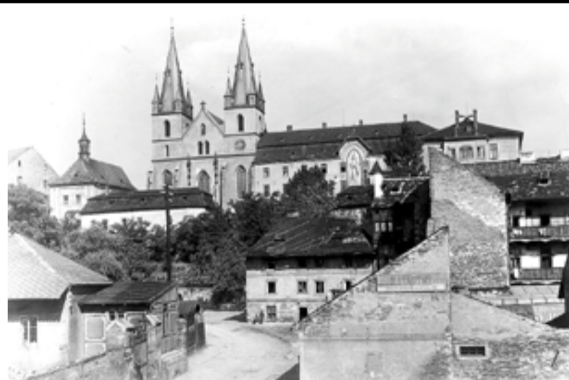
Emauzy kolem roku 1910.